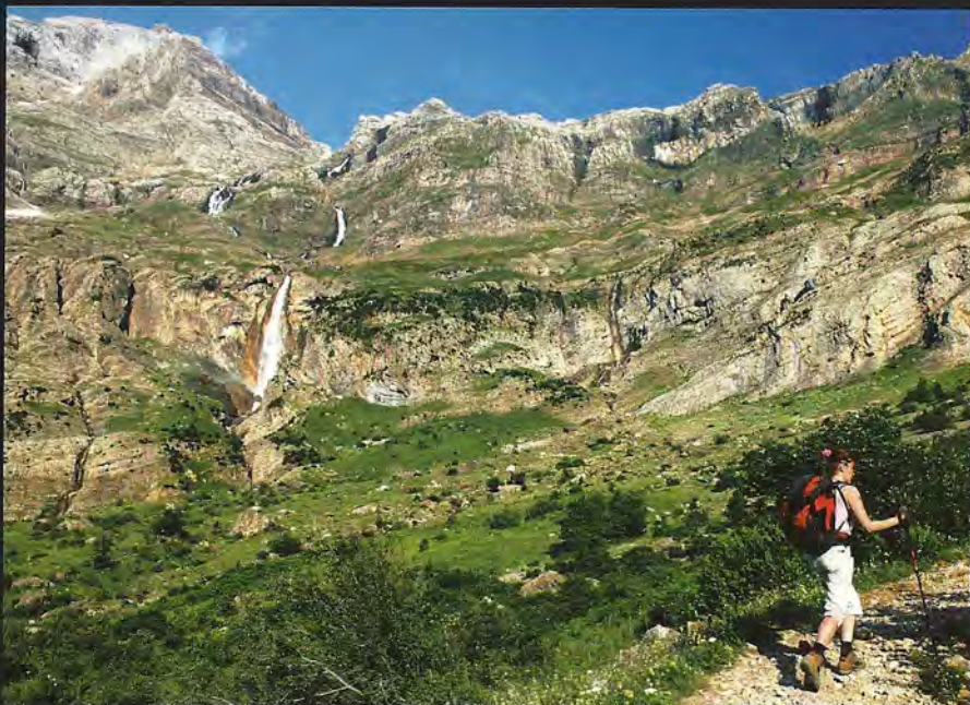
Debajo, la cascada del Cinca, en el circo de Pineta, nacimiento del río del mismo nombre. En la otra página, las célebres Gradas de Soaso.

Al comienzo del cañón de Añisclo fluye si no la más grande, sí la más curiosa cascada: la Fuen Blanca (o Fon Blanca). Nace de un agujero abierto en la ladera