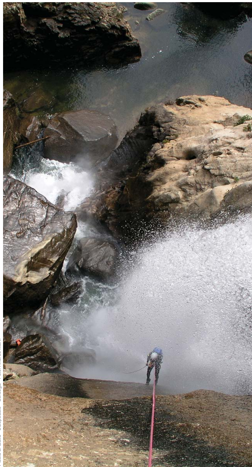
Piscia di Gallu - L'Ospedale - Córcega - Foto: Andrés Martí