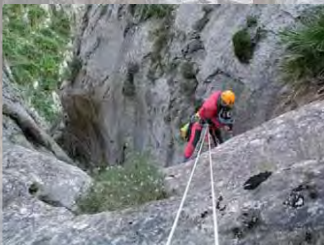
Instalación del rápel de 18m

El barranco del Pas de Calvo tiene dos barrancos tributarios por la orilla izquierda orográfica: el Barranquet de