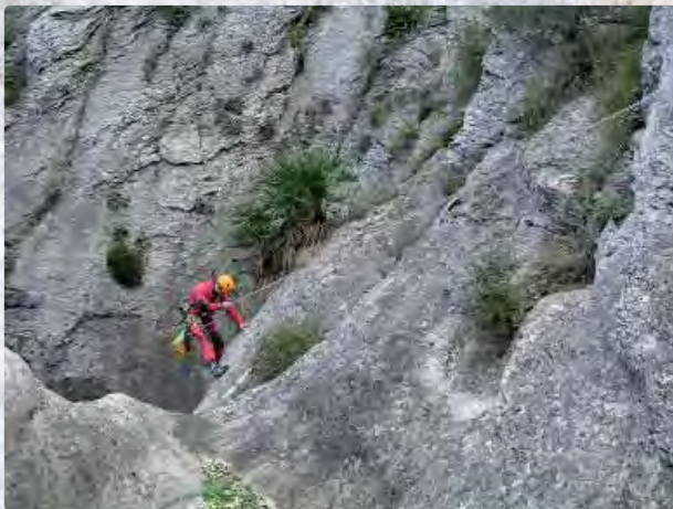
Acceso a la cabecera del rápel de 18m

Desde el parking se aprecia claramente la salida del barrancó. Para llegar al inicio del descenso deberemos subir por los campos de almendros (propiedad privada), dejando el cauce del barrancó a nuestra derecha, y buscar en la última te-