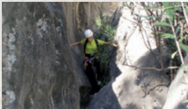
Uno de los innumerables destreps encajonados.